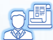
Government Electronic Trading Services