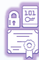
Electronic Identity Management