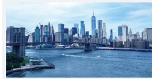
進口商安全申報及承運人附加 要求 (ISF 10+2) 至美國海關