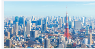
預先申報業務規則 (AFR) 至日本海關