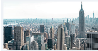
自動艙單服務 (AMS) 至美國海關