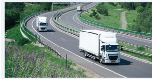
道路貨物資料系統 (ROCARS)